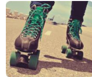
roller-skate (jeździć na wrotkach)