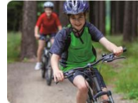
ride a bike (jeździć na rowerze)