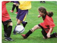
play football (grać w piłkę nożną)